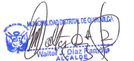
WALTER JOSUE DIAZ RAMOS Alcalde Municipalidad Distrital de Quiruvilca