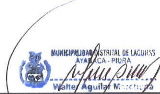
WALTER AGUILAR MARCHENA Alcalde Municipalidad Distrital de Lagunas