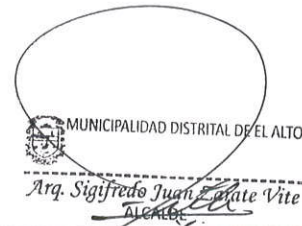
Arq. Sigifredo Juan Zarate Vite Alcalde Municipalidad Distrital de El Alto