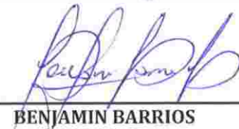
BENJAMÍN BARRIOS BELLIDO Alcalde Municipalidad Provincial de La Unión